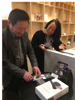
県内企業の市場調査(実演イベント等)にも活用