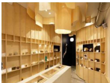
店内は新潟の風景(水,稲穂)をイメージした装飾「百年物語」プロジェクトの商品も販売