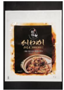
新潟親鳥かしわめし 株式会社マルコ岩村