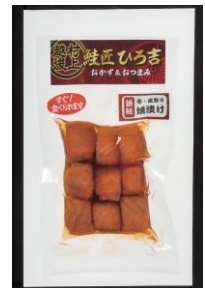
銀鮭小切焼漬 株式会社エスケー食品