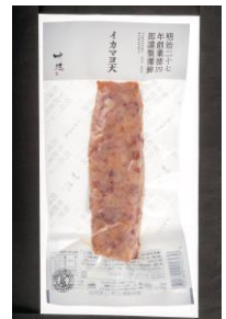
イカマヨ天 竹徳かまぼこ株式会社