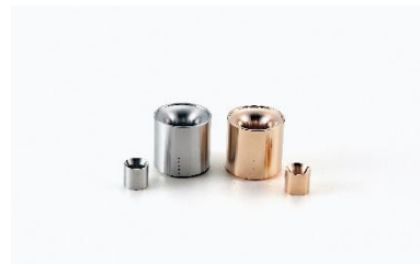
IDS大賞/新潟県知事賞