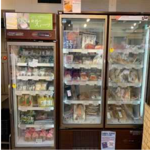
新潟をこめ (中段部 (常温))