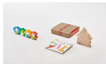
IDS大賞/新潟県知事賞

子供の五感を育むためのアイテムをトータルにデザインした企画、コンセプトの完成度が秀逸である。視点の優しさ、くみ木のデザイン力など、感性も素晴らしい。くみ木と絵本、動画がリンクする仕掛けが楽しく、ブナの間伐材を利用した地域貢献も大変良い。