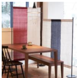
布衝立 水田(株) (小千谷市)