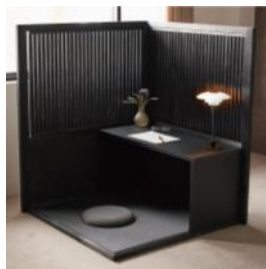
Tanza 端座 (有)野村木工所 (長岡市)