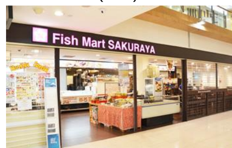
【実施予定店舗(外観)】