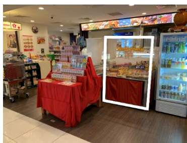
【実施予定区画(白枠内)】