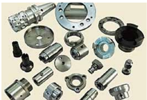
多品種・少量の切削加工