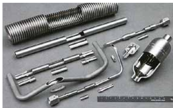
超精密特殊鏡面研磨