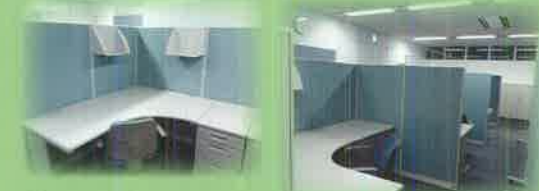
パーティションで仕切ること でプライバシーを確保。集中して仕事ができます。