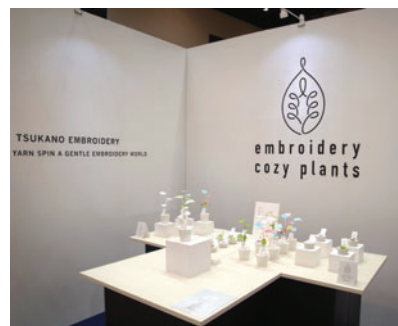
プロトタイプ発表の様子 (アオーレ長岡)

NICO Niigata Industrial Creation Organization 公益財団法人 にいがた産業創造機構