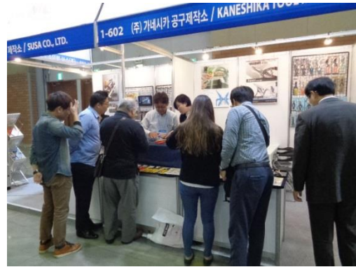
ナカヤと金鹿工具製作所のブース