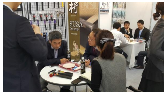
ブース内での商談の様子