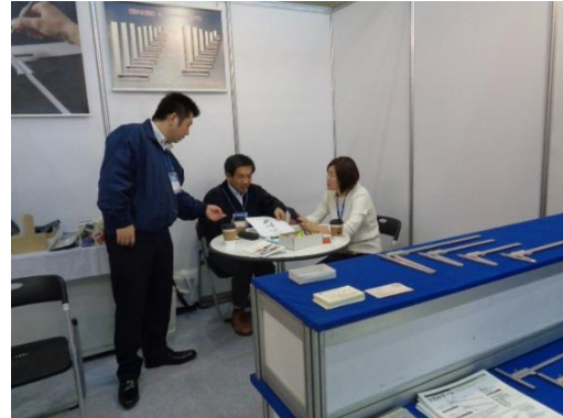
須佐製作所と松井精密工業のブース