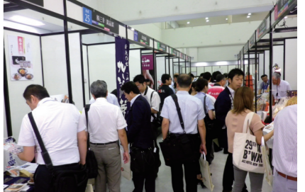
うまさぎっしり新潟・食の大商談会 2016の様子