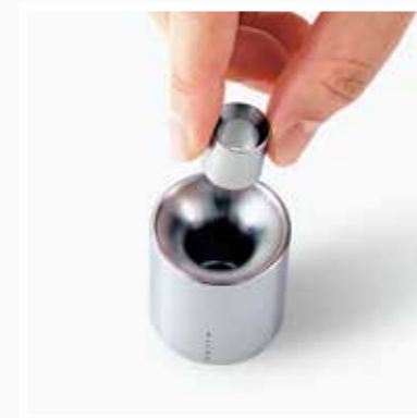
※付属のアダプター