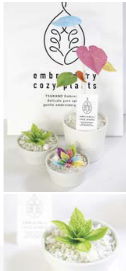
『embroidery cozy plants』は、今年4月から新潟伊勢丹・越前コーナードで販売されており、記念日やお祝いのプレゼントに購入する人も多いとか。小さいタイプはオフィスの机に置くのもおすすめ。