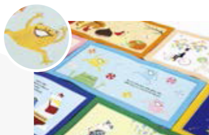
「ししゅうのえほん」の12か月シリーズは、それぞれの季節に合わせたストーリーと絵を刺繍で表現した温もりのある絵本。柔らかく軽いので、持ち運びにも便利。インテリアとしても楽しめる。

同社の持つ高い技術とデザイナーによる斬新な発想が、新しい可能性を生み出した理想的な例といえるだろう。