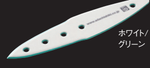
ホワイト/ グリーン