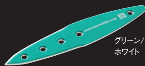
グリーン/ ホワイト

企業名:株式会社ネオス デザイナー:小林南穂 材質:和紙、桐 サイズ:(本体)W372×H16×D147mm (ケース)W372×H17×D148mm 重量:(本体)12g、(本体+ケース)150g カラー:柄組み合わせ4タイプ