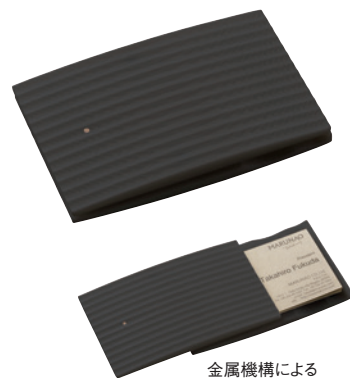
金属機構による スライド式

ステーションナリー Business Card Case ¥20,000 (税別)