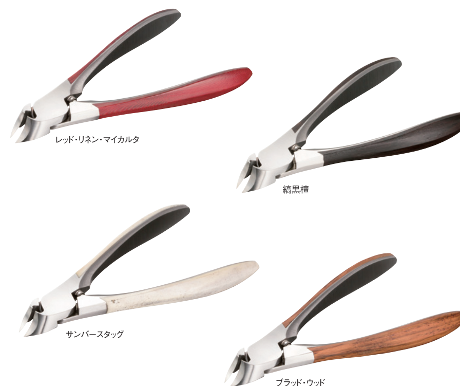
レッド・リネン・マイカルタ