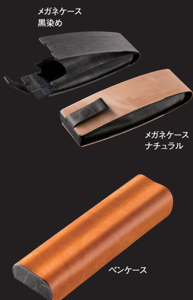
メガネケース 黒染め