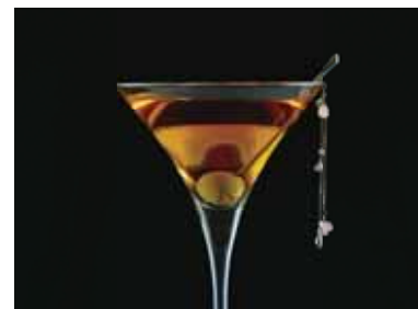
レジェ(株) 純チタン カクテルジュエリー クリスタル