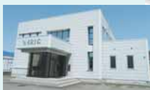
NICOテクノプラザ隣(長岡市)