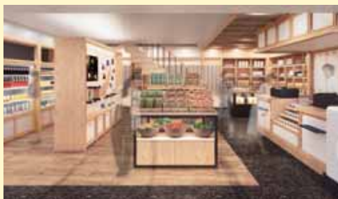
■1階：県産食品・飲料、軽食等販売

■地下1階：移住相談窓口 ■2階：日本酒試飲、酒類・工芸品等販売 ■8階：飲食店舗