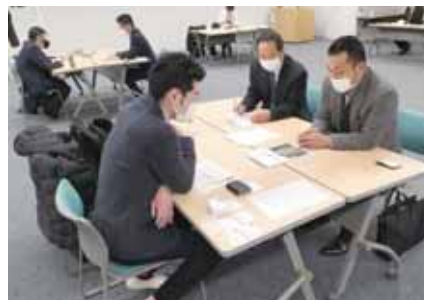
実戦商談会の様子