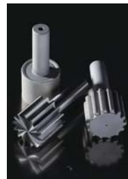
造形品(フライスカッター)