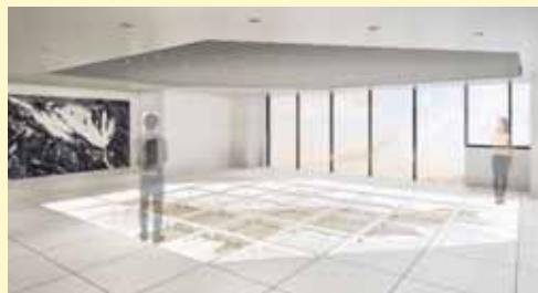
■3階：イベントスペース