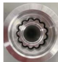
水素生成装置のプロトタイプ