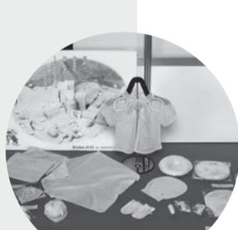
第17回(2007) 作品 / 良寛シルク ベビー用品 出品者 / 株式会社金子編物