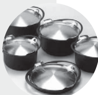
第21回(2011) 作品 / IMONO 両手鍋 出品者 / 株式会社三条特殊鋳造