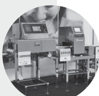
第19回(2009) 作品 / 食品の異物検査、自動選別システム (X線異物検査機) 出品者 / 株式会社システムスクエア