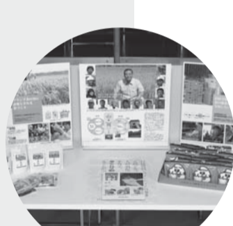
第18回(2008) 作品 / 「健康者・食事制限者が安心な 保存食と土への循環リサイクル 「はんぶん米」」 出品者 / 株式会社エコ・ライス新潟