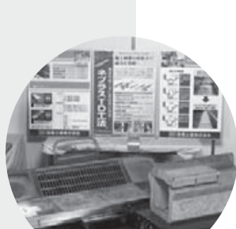
第16回(2006) 作品 / 側溝修繕ネプラスTD工法 出品者 / 株式会社高橋建設