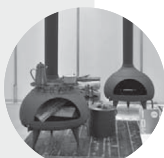
第20回(2010) 作品 / 「火のタマゴ」・鑄物薪ストーブ 出品者 / 株式会社三条特殊鋳造