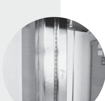
第15回(2005) 作品 / 夢の雨水利用システム 「ホームタンカー100L」 出品者 / 株式会社五十嵐工業